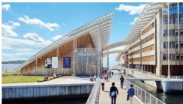
Astrup Fearnley Museet

Arrangörer är Leksands Konstsällskap och Tällbergs konstförening.