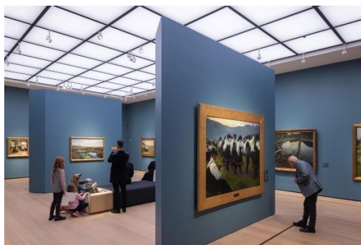
Interiör från nya Nationalmuseet for Kunst

Årets stora konstresa går som vi tidigare meddelat till Oslo. En stad som har växt snabbt och bland annat erbjuder ett spännande utbud av museer, skulpturparker och arkitektur. Vi besöker Munch-museet, Astrup Fearnley Museet och Nationalmuseet, går på operaföreställning och gör en bussrundtur för att bekanta oss med staden. På hemvägen besöker vi en konstanläggning i Kistefos.