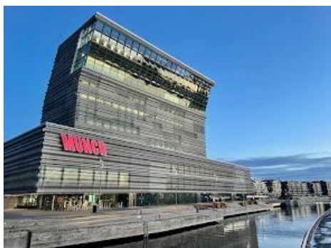
Munch museet vid Akers brygge