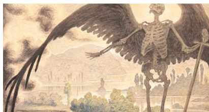
Tyra Kleen, Flykten från paradiset(beskuren),1909.