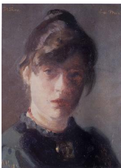
Marie Krøyer: Självpporträtt 1889 Skagens Kunstmuseer

Marie Krøyer på Waldemarsudde och Harriet Backer på Nationalmuseum.