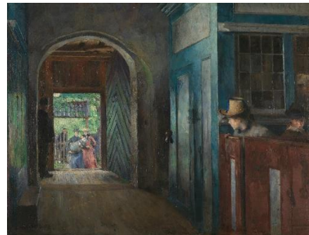
Harriet Backer, Barndop i Tanums kyrka, olja 1892 Nasjonalmuseet for Kunst, arkitektur og design, Oslo

Den stora utställningen om Marie Krøyer (1867 - 1940) och hennes konstnärskap, som sommaren 2023 visades på Skagens Museum, kommer nu till Waldemarsudde. En chans för er som inte hade möjlighet att följa med till Skagen att få uppleva hennes konst. Och för er som deltog att återuppleva den!