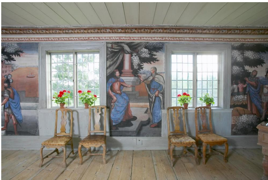
Linnés bröllopsstuga, Sveden.